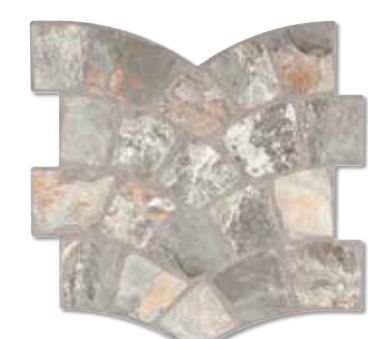
CALZADA STONE S006 35x35 cm.