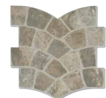
CALZADA AUGUSTA S006 35x35 cm.