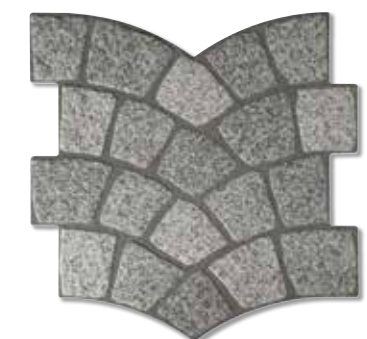
CALZADA GRANITO S006 35x35 cm.