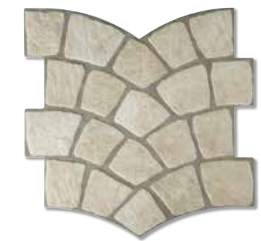
CALZADA LUSA S006 35x35 cm.