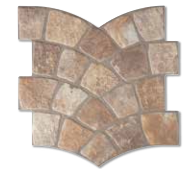
CALZADA BEIGE S006 35x35 cm.