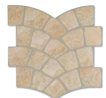
CALZADA APIA S006 35x35 cm.