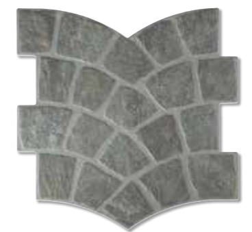
CALZADA NEGRO S006 35x35 cm.